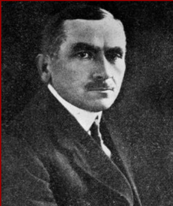
Roman Dmowski lata życia: 1864 r. - 1939 r.