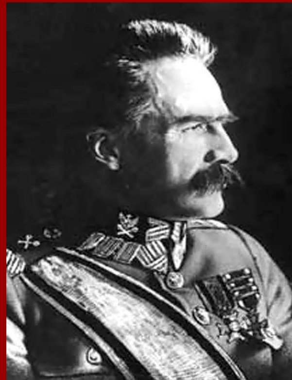
Józef Piłsudski lata życia: 1867 r. - 1935 r.